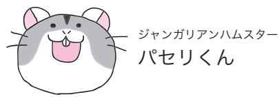
ジャンガリアンハムスター パセリくん

のんびりやで朗らかな性格だが、仕事に対する熱意はピカイチ。趣味は一人で食べ歩き。給料日には必ず街へ繰り出し散財しているらしい。