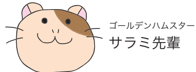
ゴールデンハムスター サラミ先輩

のんびりやで朗らかな性格だが、仕事に対する熱意はピカイチ。趣味は一人で食べ歩き。給料日には必ず街へ繰り出し散財しているらしい。